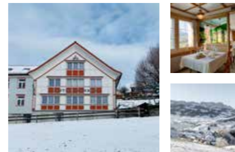
Familie Rechsteiner www.baeren-schlatt.ch

nicht buchbar 22.12.25 – 26.12.25 23.01.26 – 19.02.26