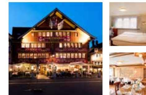
Familie Heeb www.saentis-appenzell.ch

nicht buchbar 24.12.25 – 31.12.25 12.02.26 – 16.02.26