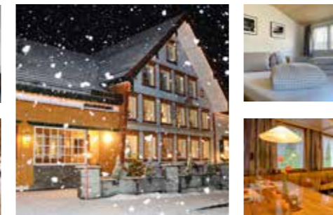
Familie Haas www.neuesbild.ch

nicht buchbar 19.12.25 – 01.01.26 04.02.26 – 22.02.26