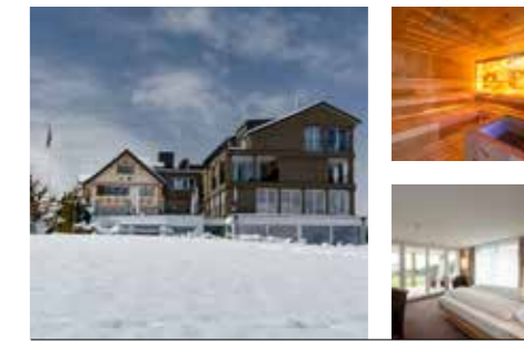
Familie Inauen www.eischen.ch

nicht buchbar 21.12.25 – 04.01.26 08.02.26 – 15.03.26