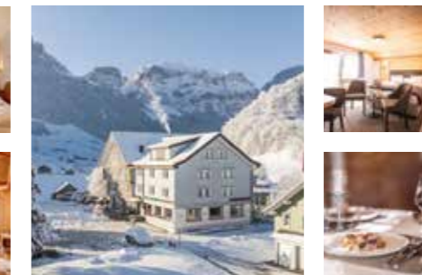
Familie Streule www.alpenblick-appenzell.ch

nicht buchbar 02.11.25 – 02.12.25 08.02.26 – 24.02.26