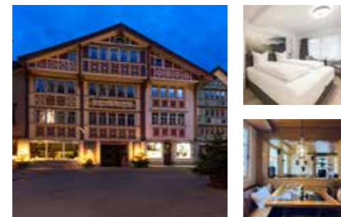
Familie Inauen www.traube-appenzell.ch

nicht buchbar 22.12.25 – 31.12.25 09.02.26 – 19.02.26