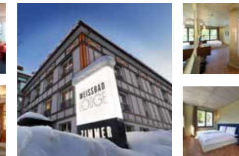
Familie Leu www.hofweissbad.ch