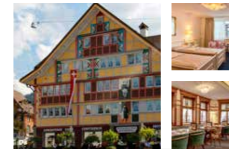
Familie Sutter www.hotel-appenzell.ch