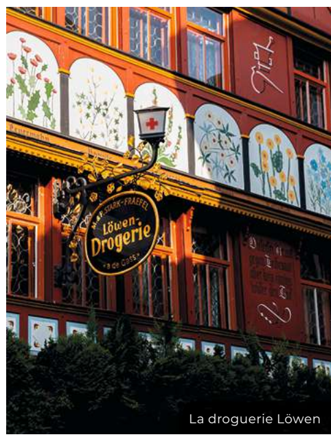
La droguerie Löwen

L'histoire et les coutumes d'Appenzell vous intéressent? Nos guides se feront un plaisir de vous accompagner au cours d'une visite découverte. Réservation: info@appenzell.ch où Tél. +41 71 788 96 41