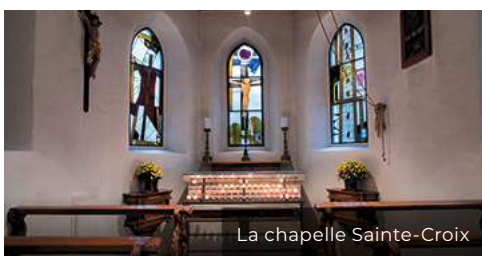
La chapelle Sainte-Croix