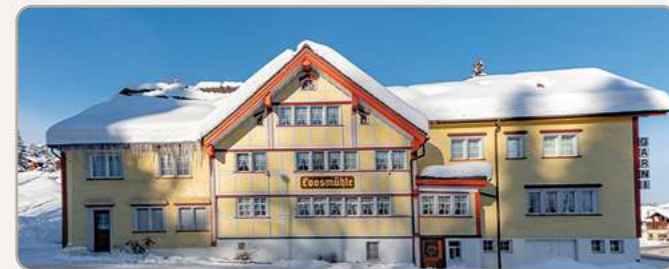
Titelbild Aussicht oberhalb Weissbad

Das detaillierte Winter-Wochenprogramm finden Sie in der Broschüre «Kultur im Winter»