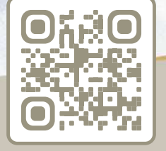
TÄGLICH AKTUALISIERTER WINTERSPORTBERICHT